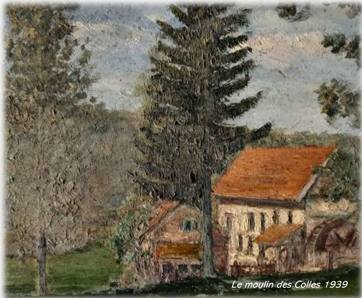
Le moulin des Colles 1939