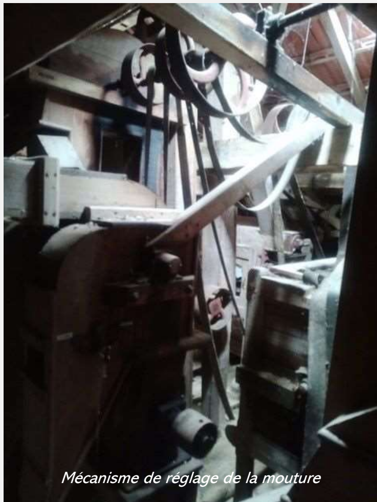
Mécanisme de réglage de la mouture