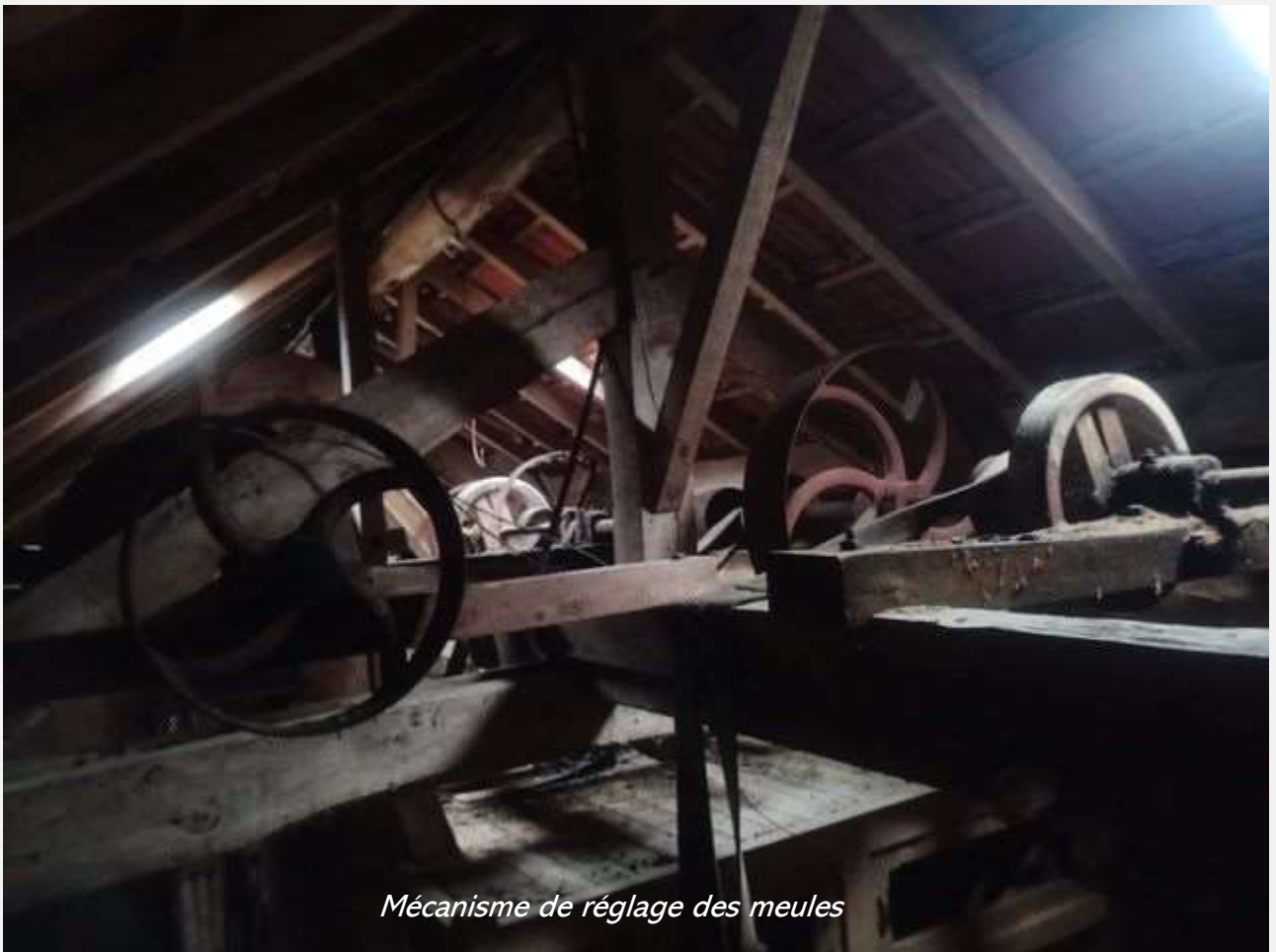
Mécanisme de réglage des meules