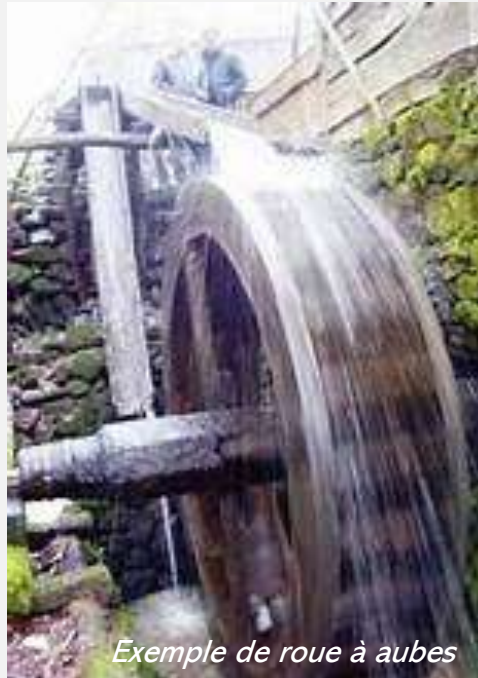
Exemple de roue à aubes

Le moulin utilisait l'énergie hydraulique ( moulin à eau ) qui était transmise à deux roues à aubes ( la roue à aubes est une roue de construction particulière, munie de pales (aubes), permettant de créer ou de restituer un mouvement rotatif d'axe au départ d'un mouvement linéaire de fluide ). L'énergie était fournie par l'écoulement de l'eau, faisant tourner les roues.